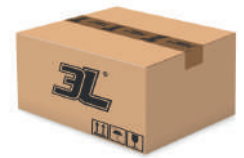
120 pares caja 120 pairs box