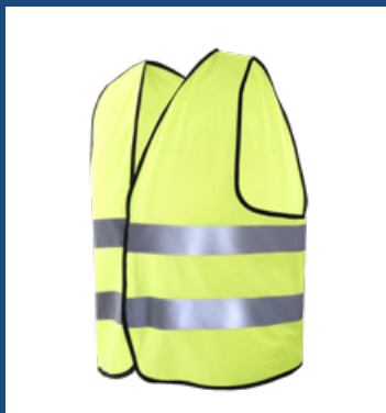
001 Amarillo AV