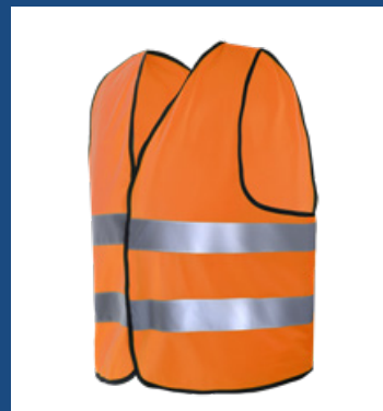
002 Naranja AV