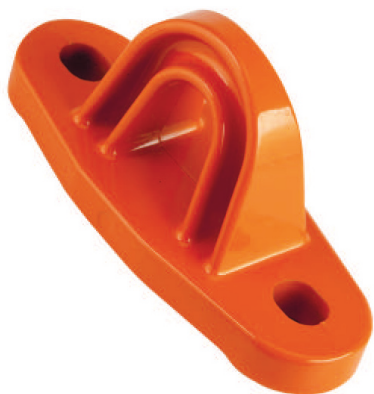
Punto de anclaje fijo para personas PAF 150