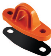
Goma de apoyo PAF 150S para Punto de Anclaje PAF 150 (Opcional)