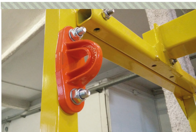
Detalle de PAF 150 en cesta para grúas CG300