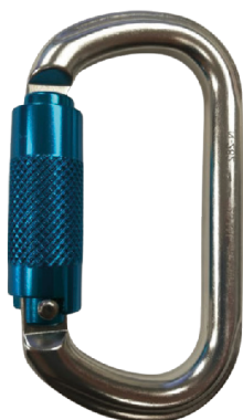
Conector desmontable. Mosquetón AA012T