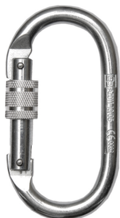
Conector desmontable. Mosquetón AA011 (N-244-O)