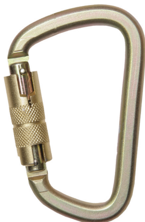
Conector desmontable. Mosquetón AA 017T (N-248)