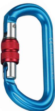
Conector desmontable. Mosquetón AA012M