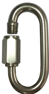
Conector desmontable. Mosquetón AA090