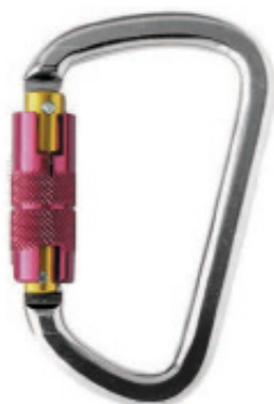
Conector desmontable. Mosquetón AA014T (N-272)