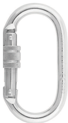
Conector desmontable. Mosquetón AA011 INOX