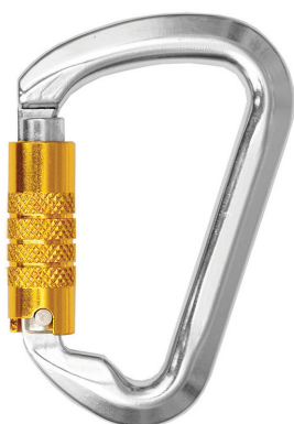
Conector desmontable. Mosquetón AA014DT