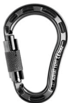
Conector desmontable. Mosquetón AA 019T