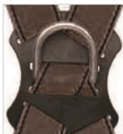
Vista trasera del arnés con el punto de anclaje dorsal