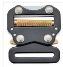
Detalle de la hebilla de conexión-regulación (cierres automático)