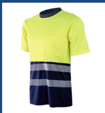
31 Marino/Amarillo AV