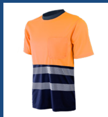
32 Marino/Naranja AV