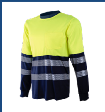
031 Marino/ Amarillo AV