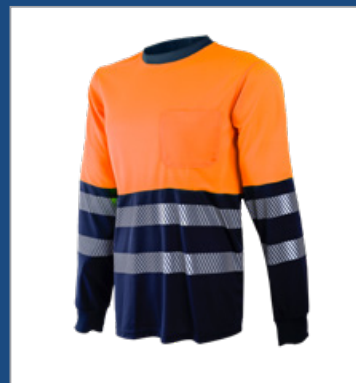
032 Marino/ Naranja AV