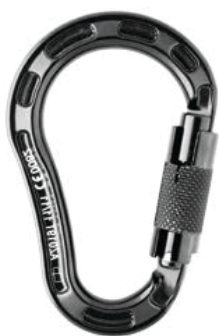
Conector desmontable. Mosquetón AA 019T