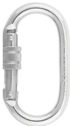
Conector desmontable. Mosquetón AA 011 INOX