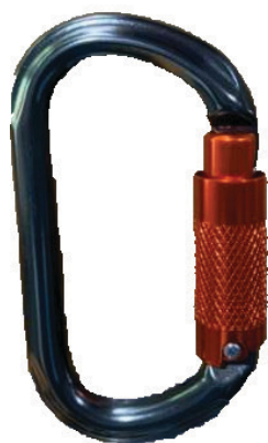
Conector desmontable. Mosquetón AA 012 DT