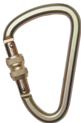
Conector desmontable. Mosquetón AA 018