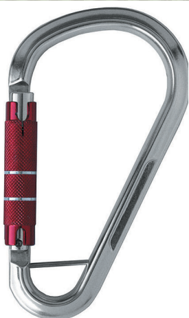
Conector desmontable. Mosquetón AA 111B