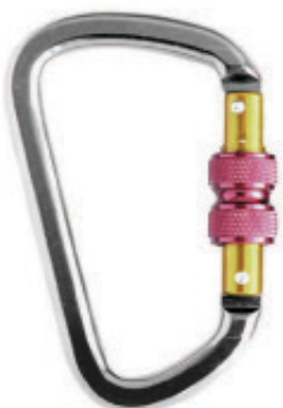
Conector desmontable. Mosquetón AA 014