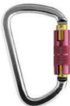
Conector desmontable. Mosquetón AA 014T (N-272)