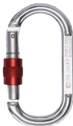
Conector desmontable. Mosquetón AA 012