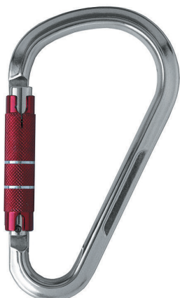
Conector desmontable. Mosquetón AA 111