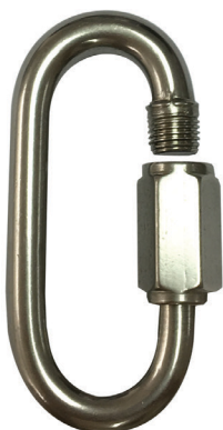
Conector desmontable. Mosquetón AA 090