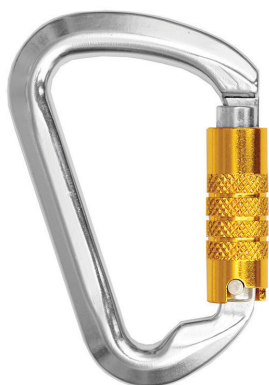
Conector desmontable. Mosquetón AA 014DT