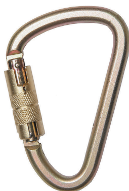
Conector desmontable. Mosquetón AA 018T