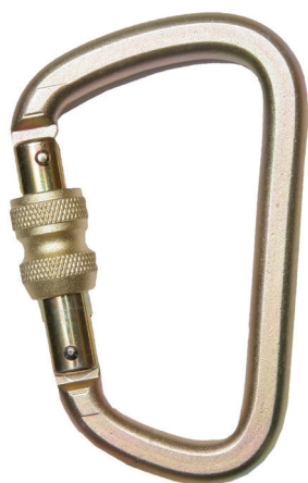
Conector desmontable. Mosquetón AA 017