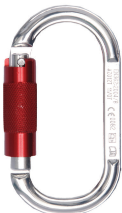
Conector desmontable. Mosquetón AA 012T