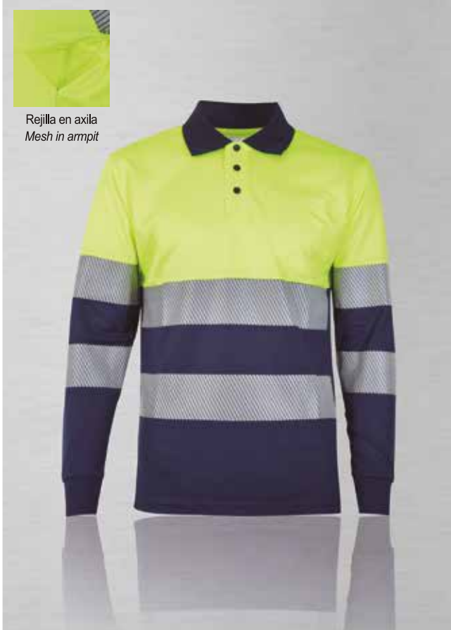
Rejilla en axila Mesh in armpit