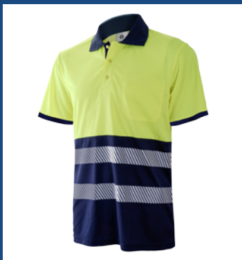
031 Marino/Amarillo AV