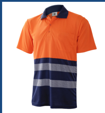
032 Marino/Naranja AV