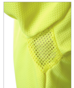
Detalle de las axilas