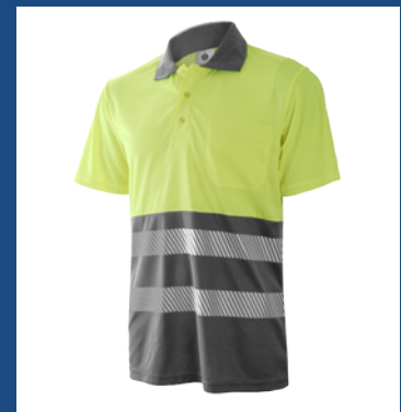
051 Gris/Amarillo AV