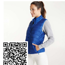
OSLO WOMAN RA5093