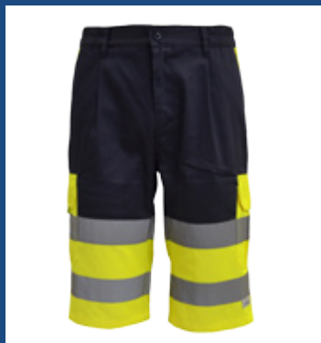
031 Marino/Amarillo AV