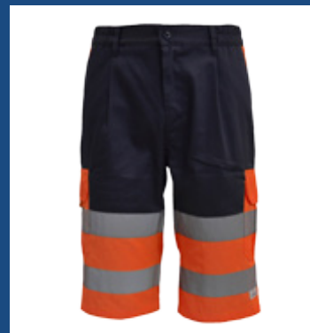
032 Marino/Naranja AV