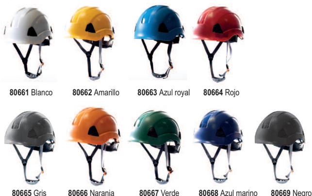
80661 Blanco 80662 Amarillo 80663 Azul royal 80664 Rojo 80665 Gris 80666 Naranja 80667 Verde 80668 Azul marino 80669 Negro