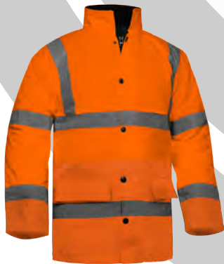
Imagen de Archivo:

Es conforme a las disposiciones del reglamento aplicable (UE) 2016/425 del 9 de Marzo de 2016. Así mismo, cumple con las exigencias recogidas en las normas europeas EN ISO 13688:2013 (exigencias generales de ropa de protección), EN ISO 20471:2013/A1: 2016 (ropa de protección de señalización de alta visibilidad), EN 14058:2017 (ropa de protección para ambientes fríos) y EN 343:2003 + A1:2007/AC: 2009 (ropa de protección contra la lluvia). Habiendo alcanzado los niveles de prestación según se especifica en el informe de ensayo 2019EP1125 y la documentación técnica del E.P.I. y es idéntico al E.P.I. de categoría II objeto del certificado de examen UE de tipo (módulo B) con número 19/1628/00/0161 emitido por el organismo notificado nº 0161 Aitex, Instituto Tecnológico Textil, Plaza Emilio Sala, 1 - 03801 Alcoy (Alicante) España.