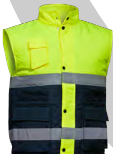
Imagen de Archivo:

Normas aplicables, normas internacionales de ensayo u otros requisitos.